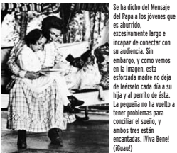
Se ha dicho del Mensaje del Papa a los jóvenes que es aburrido, excesivamente largo e incapaz de conectar con su audiencia. Sin embargo, y como vemos en la imagen, esta esforzada madre no deja de hacerlo cada día a su hijo y al perito de ésta. La pequeña no ha vuelto a tener problemas para conectar el sueno, y ambos tres están encantados. ¡Viva Benet! (Gisael)