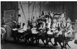
Catequista de la parroquia Ntra. Sra. de los Desamparados explicando la liturgia de la JMJ a un grupo de voluntarios indígenas. A la izquierda, ex-voluntario castigado por preguntar por qué los jóvenes sólo se interesan por los jóvenes en las JMJs.

* Adaptación libérrima de El Gran Inquisidor, de F. Dostoyevski.